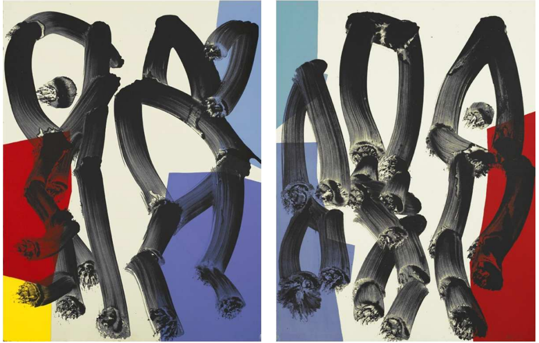
NAVEGANTE DE SUEÑOS, 2006 Litografía. 80 x60 cm

Colección de dos obras estampadas en el taller de litografías de Antonio Gayo, Madrid, sobre papel Velín Arches de 300 gr de medidas 80x 60 cm con aproximadamente nueve planchas litográficas cada pieza.