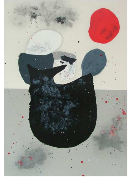
DE KOONING HA PERDIDO LA OLLA, 2008 Litografía. 100 x70 cm

Colección de dos obras estampadas en el taller de litografías de Antonio Gayo, Madrid, sobre papel Velín Arches de 300 gr de medidas 100 x 70 cm con aproximadamente nueve planchas litográficas cada pieza.