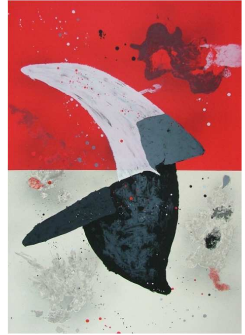
EL SOMBRERO PAYÉS DE MIRÓ, 2008 Litografía. 100 x70 cm

Colección de tres obras estampadas en el taller de litografías de Antonio Gayo, Madrid, sobre papel Velín Arches de 300 gr de medidas 100 x 70 cm con aproximadamente nueve planchas litográficas cada pieza.