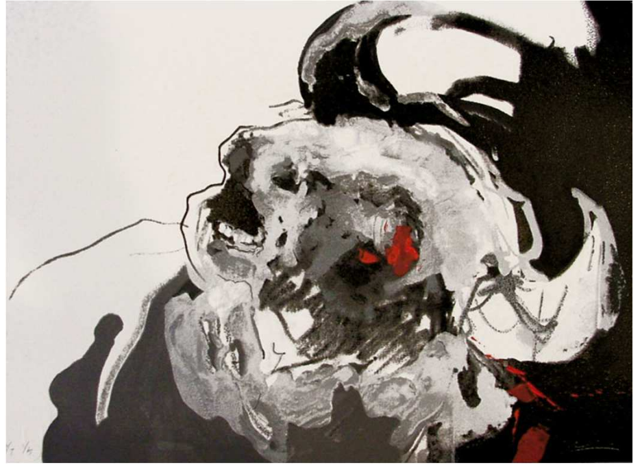
CABEZA DE TORO, 2007 Serigrafía iluminada. 28,5 x 38,5 cm

Obra estampada en el taller de serigrafía de Pepe Herrera con diez pantallas serigráficas, Madrid, papel Fabriano. Diseño de 300 gr de medidas 28,5 x 38,5 cm.