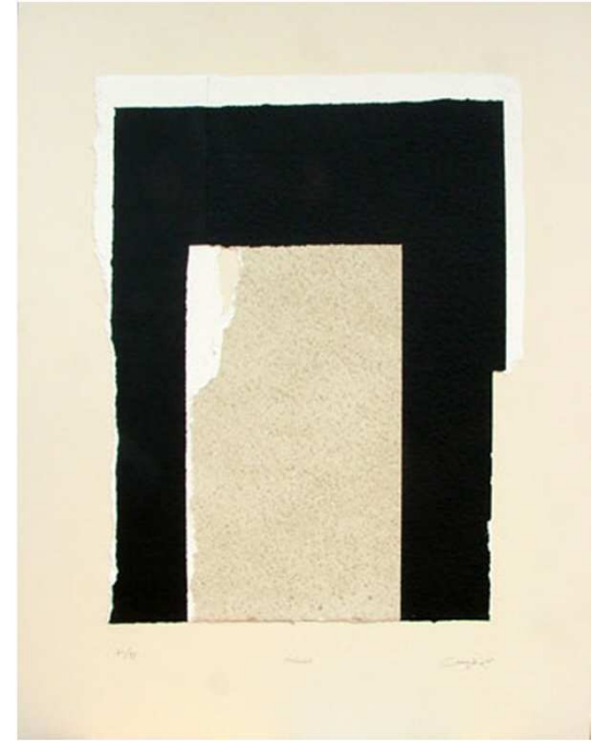
MÓDULO, 2005 Serigrafía y collage. 90 x70 cm

Obra estampada en el taller de serigrafía de Pepe Herrera, Madrid, papel Eskulan hecho a mano sobre cartón Pankaster de 3 mm de medidas 90x 70 cm.